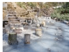
大湯沼川天然足湯